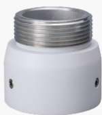
L-HA7 Adapter für Domekamas