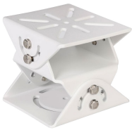
L-TH1 3-axiale Gehäusehalterung